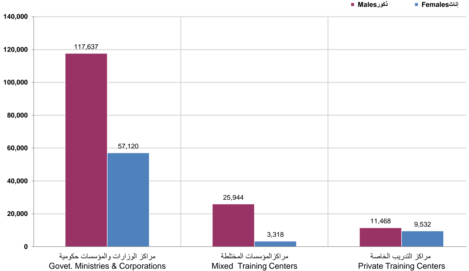
شكل رقم (33) Graph